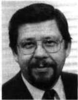
Prof. Dr. habil. Günter Schmitt , geb. 1942; Chemiestudium an der Univ. Köln und an der TH Aachen. Über 20jährige Forschungstätigkeit auf dem Gebiet Korrosionsinhibitoren, Vors. der GIKORR-Ges. f.

Zur Begriffsbestimmung soll einleitend die Definition des Ausdrucks »Inhibitor« vorangestellt werden. Nach ISO 8044 [1] sind Inhibitoren chemische Substanzen, welche die Korrosionsrate senken, wenn sie in geeigneten, im allgemeinen sehr geringen Konzentrationen im Korrosionsmedium anwesend sind. Dabei soll jedoch die Konzentration irgendwelcher korrosiver Angriffsmittel nicht wesentlich verändert werden. Demnach gehören solche Substanzen nicht zu den Korrosionsinhibitoren, die lediglich zur Veränderung des pH-Wertes oder der Sauerstoffkonzentration zugesetzt werden.